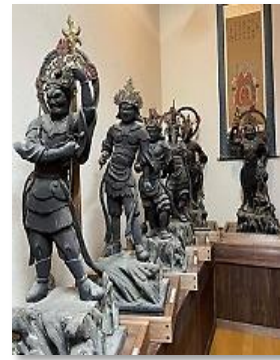
新旭町日爪 堂立山 慈恩寺 十二神将像の一部 (慈恩寺保存会)

参加団体は、20団体に高島市の文化財課が加わり、古文書や郷土史の団体、藤樹書院、安曇川流域文化遺産活用推進協議会のほか、盆踊り歌や古民家の保存、自然観察倶楽部など多岐にわたった団体で構成されており、高島市内3カ所の重要文化的景観の整備活用を行う水辺景観まちづくり協議会も参加しています。